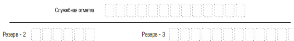
Рис. 5. Поля для служебного использования

Поля для служебного использования «Служебная отметка», «Резерв-2» и «Резерв-3» не заполняются.