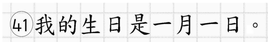
Рис.14. Образец написания иероглифических знаков

Односторонний бланк ответов № 2 (лист 1 и лист 2) предназначен для записи ответов на задания с развернутым ответом по китайскому языку (строго в соответствии с требованиями инструкции к КИМ и к отдельным заданиям КИМ). Каждый иероглифический знак и каждый знак препинания следует писать внутри отдельной клетки области ответов бланка ответов №2 (дополнительного бланка ответов №2) (рис. 14).