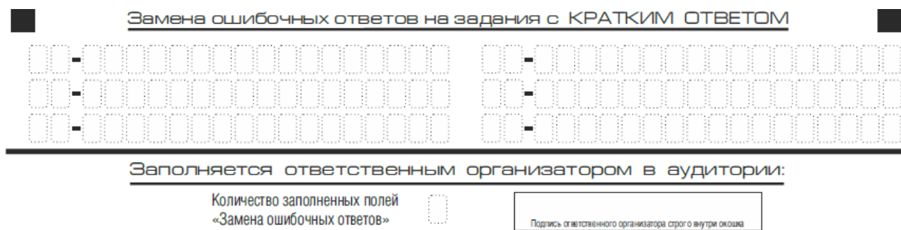
Рис. 9. Область замены ошибочных ответов на задания с кратким ответом

Запрещается записывать ответ в виде математического выражения или формулы. В ответе не указываются названия единиц измерения (градусы, проценты, метры, тонны и т.д.) – так как они не будут учитываться при оценивании. Недопустимы заголовки или комментарии к ответу.